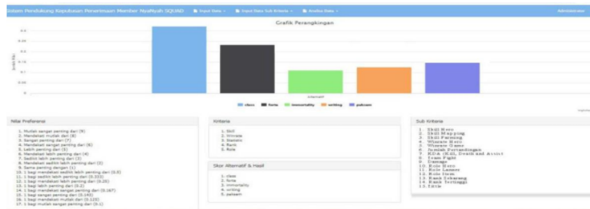
Gambar 4. Tampilan Dashboard