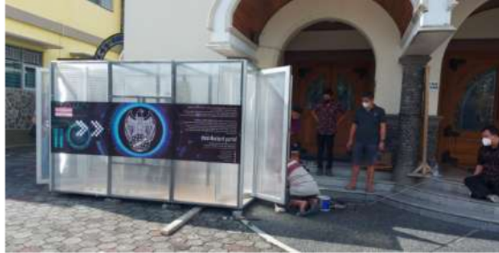
Gambar 3. Pemasangan Alat Desinfectant Portal

Pemasangan telah dilakukan sedemikian rupa sampai alat ini bisa berfungsi dengan baik. Setelah alat terpasang, maka diajarkan juga cara pemakaian dan cara pemeliharaan alat tersebut. Sebuah buku panduan diberikan untuk membantu mengingat cara pemakaiannya. Pada alat ini dipasang lambang dan kata-kata yang menunjukkan bahwa Universitas Stikubank (UNISBANK), Fakultas Teknik, Program Studi Teknik Industri yang memproduksi alat Desinfectant Portal ini.