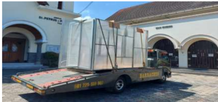
Gambar 2. Kendaraan Pengangkut dan Alat Desinfectant Portal