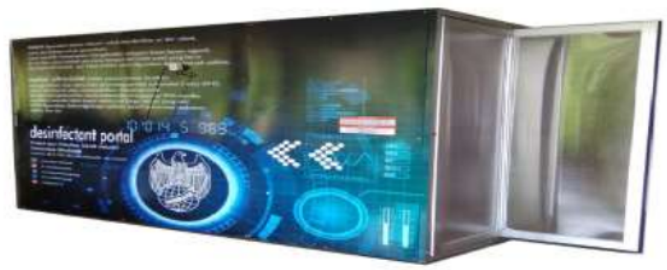
Gambar 1. Desinfektant Portal

Komponen dari alat ini adalah lampu UVC, Ozon dan Box Panel. Spesifikasi Desinfektant Portal