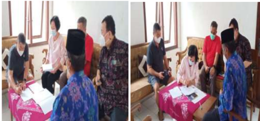
Gambar 4. Serah Terima Alat Desinfectant Portal

Alat Desinfectant Portal diserahkan oleh Ketua Tim Pengabdian mewakili Pihak Pemberi dan diterima oleh Bendahara Dewan Pastoral Paroki Harian Paroki Santo Petrus dan Paulus sebagai Pihak Penerima. Serah terima ini dituangkan dalam sebuah memorandum of understanding (MoU), yang ditandatangani oleh kedua belah pihak.