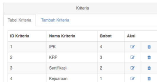
Gambar 2. Tampilan Bagian Kriteria.

Selanjutnya adalah halaman untuk bagian kriteria yang dapat dilihat seperti gambar 2. Halaman ini digunakan untuk mengelola data kriteria.