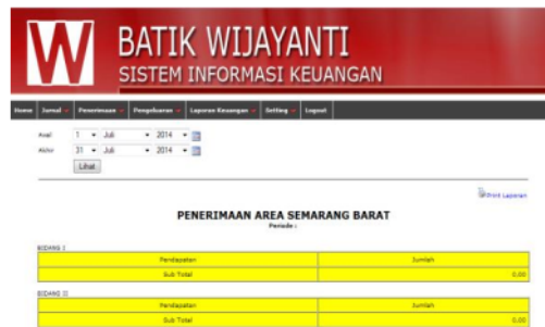
Gambar 8. Tampilan Penerimaan Area

Mengenai data pengeluaran, bentuk tampilan antarmukanya dapat dilihat sebagaimana pada gambar 9 dan 10. Data pengeluaran tercatat per divisi perusahaan dan total penggunaan anggaran pengeluaran untuk pusat dan area.