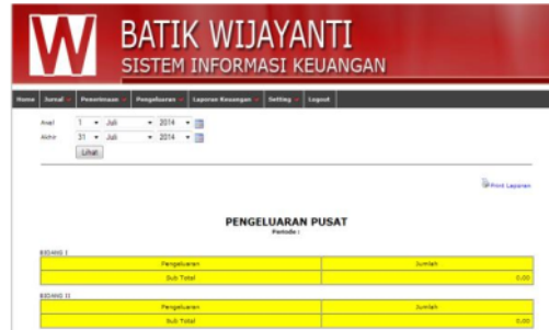
Gambar 9. Tampilan Pengeluaran Pusat

Mengenai data pengeluaran, bentuk tampilan antarmukanya dapat dilihat sebagaimana pada gambar 9 dan 10. Data pengeluaran tercatat per divisi perusahaan dan total penggunaan anggaran pengeluaran untuk pusat dan area.