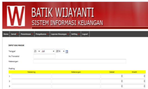
Gambar 5. Halaman Input Transaksi

Menu Jurnal mempunyai tampilan untuk melakukan input transaksi seperti pada gambar 5 dan data transaksi seperti terlihat pada gambar 6.