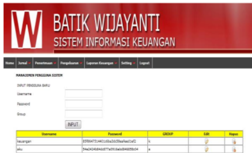
Gambar 16. Tampilan Setting Pengguna Sistem