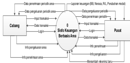
Gambar 1. Context Diagram Sisfo Keuangan Berbasis Area

Bagian Pusat juga melakukan Login untuk mengakses sistem ini. Pusat dapat memasukkan Info penerimaan, Info pengeluaran, Menambah rekening baru, dan Input transaksi. Dan oleh sistem keuangan ini, Pusat diberikan akses terhadap Data penerimaan periodik, Data pengeluaran periodik, dan Laporan keuangan (BB, Neraca, R/L, Perubahan modal).