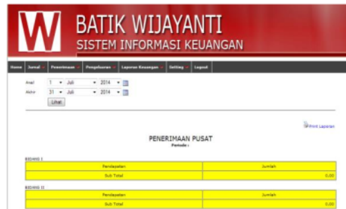
Gambar 7. Tampilan Penerimaan Pusat

Menu untuk mencatat data tentang penerimaan perusahaan tampak seperti pada gambar 7 dan gambar 8. Data penerimaan tercatat per periode akuntansi sesuai dengan masing-masing divisi di dalam perusahaan, dan juga memuat informasi total pendapatan yang diterima oleh perusahaan.