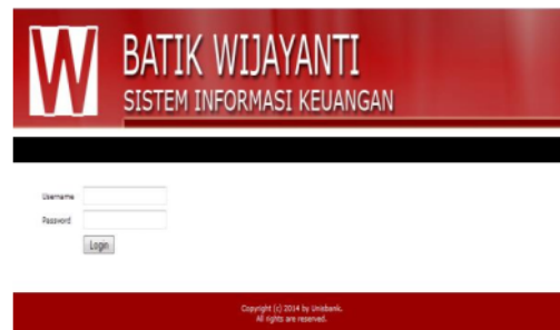
Gambar 4. Halaman Login

Setiap user wajib melakukan login terlebih dahulu untuk mendapatkan akses tentang pencatatan transaksi keuangan sesuai kebutuhan.