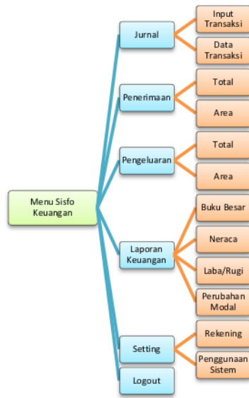
Gambar 3. Hierarki Menu Sisfo Keuangan