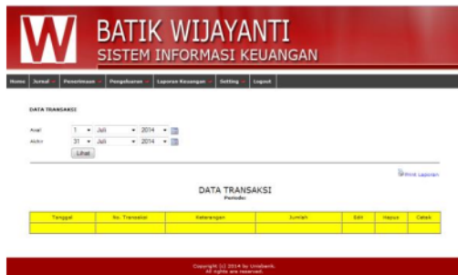
Gambar 6. Halaman Data Transaksi

Menu untuk mencatat data tentang penerimaan perusahaan tampak seperti pada gambar 7 dan gambar 8. Data penerimaan tercatat per periode akuntansi sesuai dengan masing-masing divisi di dalam perusahaan, dan juga memuat informasi total pendapatan yang diterima oleh perusahaan.