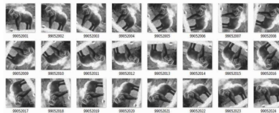
Gambar 2. Penyusunan data sub-citra (i)

Data citra yang digunakan untuk penelitian ini berukuran 512X512 dan 256X256 piksel. Proses resize bertujuan untuk menyesuaikan ukuran data citra sehingga ukuran data citra adalah sama dengan ukuran citra query, pada penelitian ini adalah 128X128 piksel. Data citra yang telah berukuran 128X128 piksel disebut juga dengan istilah data sub-citra. Data sub-citra dapat dilihat pada gambar 5.1, Gambar 5.2., Gambar 5.3, Gambar 5.4, dan Gambar 5.5.