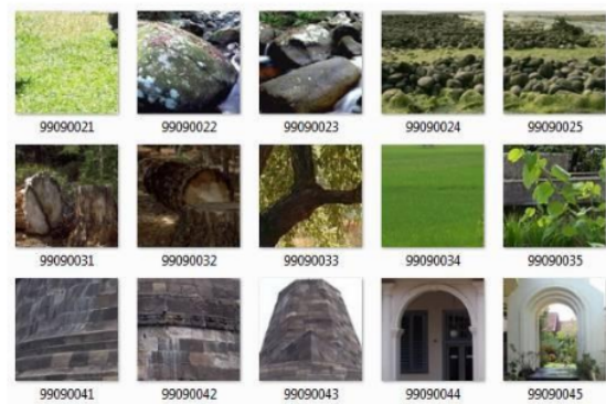
Gambar 6. Penyusunan data sub-citra (v)