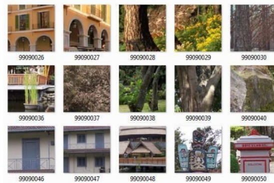
Gambar 5. Penyusunan data sub-citra (iv)