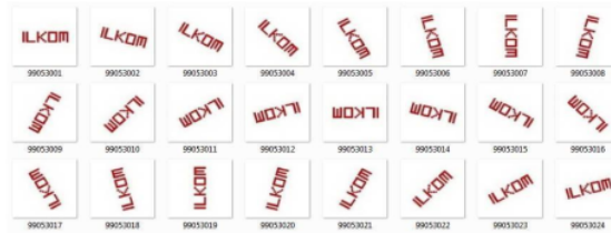
Gambar 4. Penyusunan data sub-citra (iii)