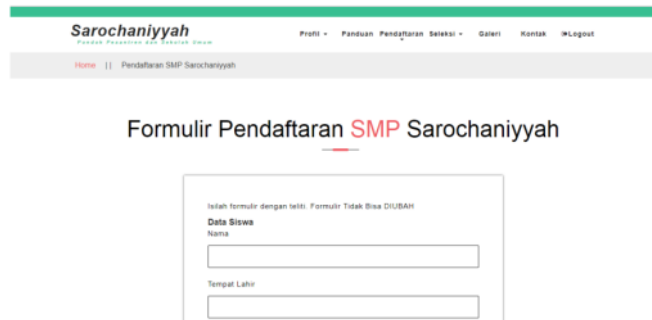
Gambar 3. Tampilan Halaman Pendaftaran

Lalu Pengimplementasian pada web adalah sebagai berikut :