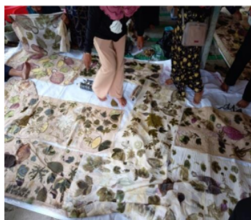
Hasil kain dengan Teknik Ecoprint