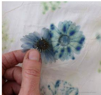
Diambil daunnya pigment daun