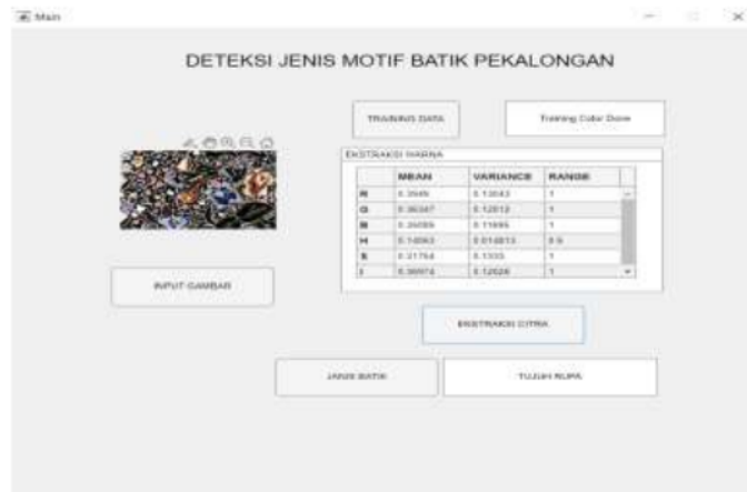
Gambar 3.2 Tampilan User Interface Aplikasi

Proses pengujian pada penelitian dilakukan dengan software Matlab R2022b. dengan tampilan user interface.