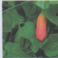
Daun Coccinia Grandis