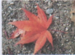
Daun Maple

Video ini menggambarkan teknik proses pembuatan motif Rindang Amboja Krama dengan teknik Ecoprint dari perpaduan antara daun Maple Kering, Daun Pepaya Jepang, Daun Bambu Jepang dan daun Timun Mas yang menghasilkan motif unik dengan latar belakang warna abu-abu.