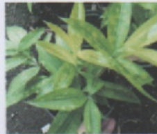
Daun Bambu Jepang