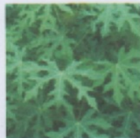
Daun Chaya