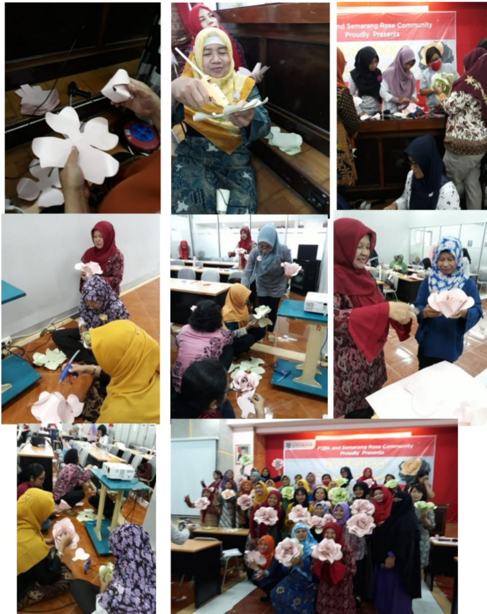
Gambar 3.2 Hasil Akhir Pelatihan dan Bimbingan Teknis.