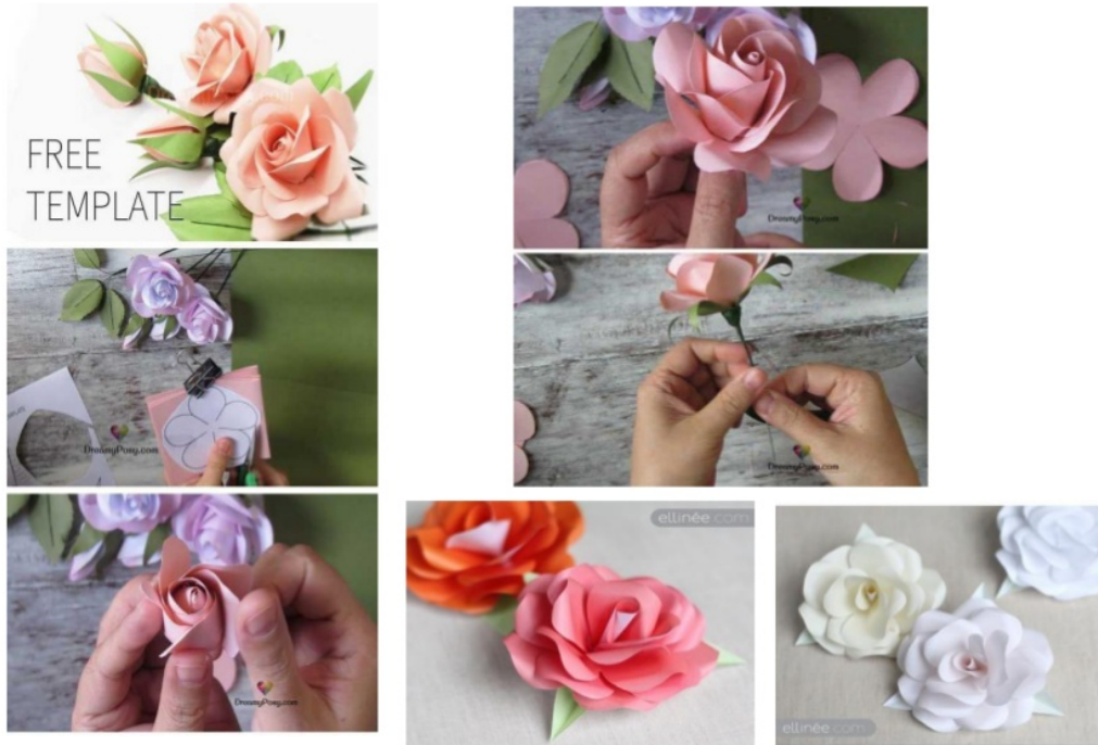
Gambar 2.1 Pola Mawar dan Kuntum Mawar Berbahan Kertas