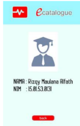
Gambar 4. Halaman menu profil

Pada Gambar 4 dibawah menampilkan menu profil yang ada di aplikasi setelah user menekan tombol menu profil pada halaman utama. Dan pada halaman ini terdapat tombol back yang berfungsi untuk mengembalikan tampilan ke halaman utama jika tombol tersebut ditekan.