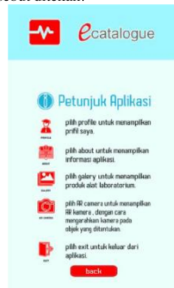
Gambar 7. Halaman Petunjuk

Pada Gambar 7 dibawah menampilkan menu petunjuk yang ada di aplikasi setelah user menekan tombol menu petunjuk pada halaman utama. Dan pada halaman ini terdapat tombol back yang berfungsi untuk mengembalikan tampilan ke halaman utama jika tombol tersebut ditekan.