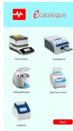
Gambar 6. Halaman Galeri