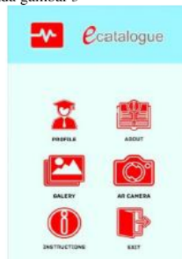
Gambar 3 Halaman Utama Aplikasi

Masing-masing tombol pada halaman utama ini adalah tombol profil, tombol about, tombol galeri, tombol AR kamera, tombol instruksi dan tombol keluar. Saat pertama kali aplikasi ini dibuka sistem akan merespon dengan menampilkan halaman utama ini.terlihat pada gambar 3