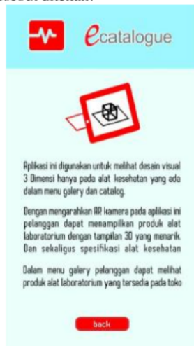
Gambar 5. Halaman Tetang / About

Pada Gambar 5 dibawah menampilkan menu tentang yang ada di aplikasi setelah user menekan tombol menu about pada halaman utama. Dan pada halaman ini terdapat tombol back yang berfungsi untuk mengembalikan tampilan ke halaman utama jika tombol tersebut ditekan.