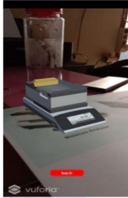
Gambar 8. Halaman AR Camera