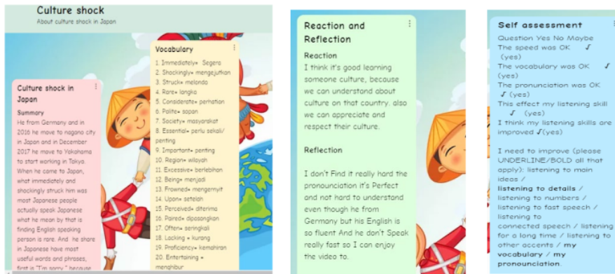
Gambar 1. Contoh jurnal pada padlet (1) Kosakata dan tingkatan; (2) reaksi dan refleksi; (3) evaluasi

Kemampuan mahasiswa dalam menggunakan padlet terlihat sangat baik, hal itu dapat dilihat pada tampilan padlet mahasiswa. Gambar diatas merupakan contoh isi padlet salah satu mahasiswa dalam kegiatan menyimak yang dilakukan di luar kelas atau diluar pembelajaran. Tampilannya menarik dengan jenis huruf, penempatan, gambar, dan warna yang baik.