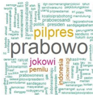
Gambar 10. Visualisasi Wordcloud