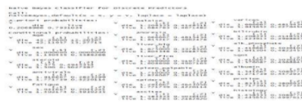
Gambar 7. Hasil Pemodelan Naïve Bayes

Dari pemodelan naïve bayes yang dilakukan didapatkan hasil probabilitas dari setiap attribute untuk kasus DIE dan LIVE dengan data yang digunakan sebanyak 116 data. Kemudian hasil prediksi tersebut dilanjutkan dengan menghitung tingkat akurasi menggunakan metode counfusion matrix . Berikut merupakan hasil perhitungan counfusion matrix dengan menggunakan package caret dan package scales untuk menghitung tingkat eror.