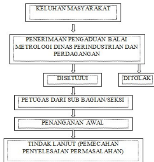
Gambar 1. Alur Pengaduan oleh Masyarakat Kepada Balai Metrologi

Sehingga dapat disimpulkan jika banyak atau rendahnya kejahatan itu tidak bisa dikatakan sebagai ukuran dari keefektifan suatu pidana penjara. Melainkan dilihat dari aspek yang mengutamakan pada tujuan untuk memulihkan keseimbangan masyarakat. Sehingga penyelesaian menggunakan jalur non penal seperti adanya pengawasan dan pembinaan oleh dinas perindustrian dan perdagangan sub bidang kemetrologian diharapkan dapat menjadi kriteria untuk mengetahui telah berlangsungnya keseimbangan pada masyarakat antara lain masyarakat sadar hukum dan tertib hukum.