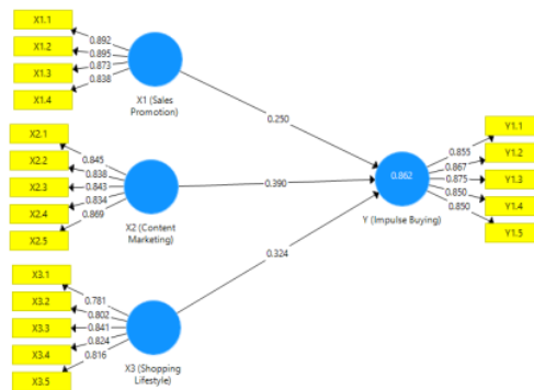
Gambar 2. Output Model.