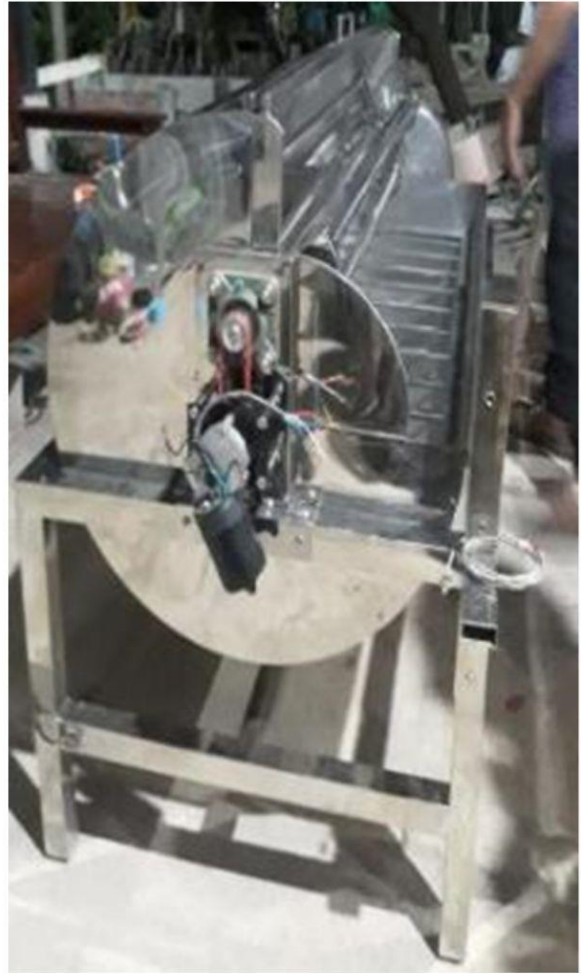
ALAT DARI SISI SAMPING