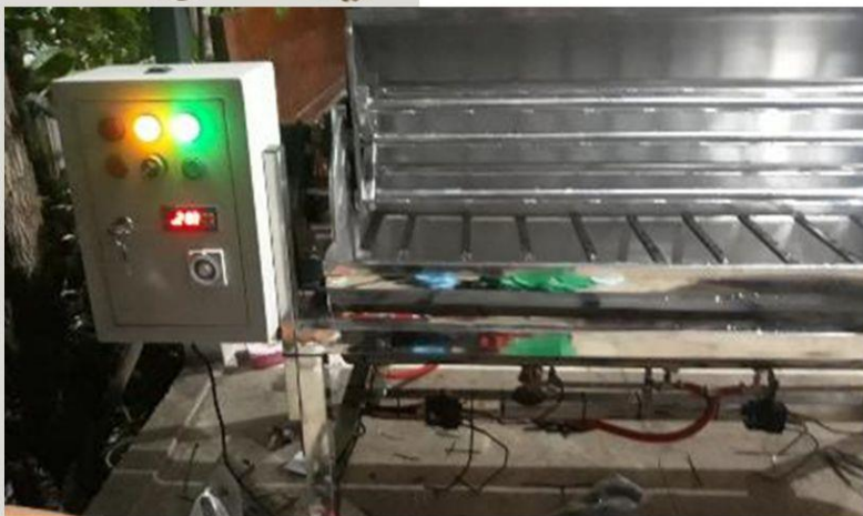
ALAT STEAMMER MASS ECOPRINT

BY KARYA KRIYA BATIK & PUSAT KAJIAN BATIK SEMARANG