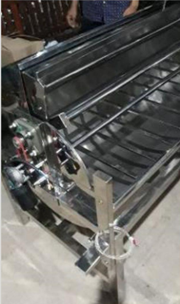
ALAT DARI SISI ATAS