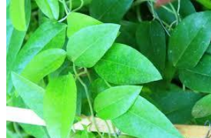
Gambar 2. Daun Cincau