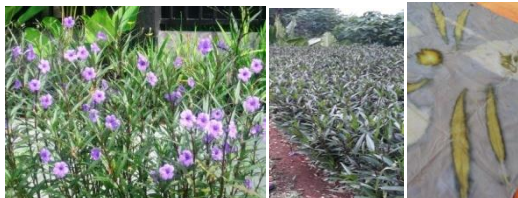
Gambar 1. Daun Bunga Ungu

Buka gulungan kain dengan melepas terlebih dahulu plastik yang membalutnya. Daun diambil dari kain untuk menghasilkan motif yang diharapkan sesuai dengan bentuk daun.