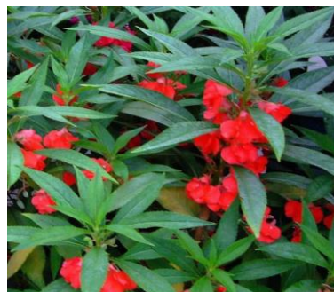
Tanaman Pacar Air