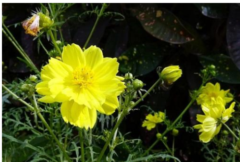
Gambar Tanaman Kenikir

Video ini menggambarkan cara membuat motif Blue Ocean dengan teknik Ecoprint Plat Indigo. Dinamakan plat Indigo karena bahan pewarna sebagai dasar tanin yang berasal dari biru Indigo dari tanaman Indigifera berupa pasta. Pasta biru diletakkan diatas kain yang sudah diratakan yang sebelumnya diletakkan plastik sebagai alas. Motif yang diinginkan dari dedaunan atau ranting maupun bunga2an diletakkan diatas pasta biru. Motif blue ocean terdiri dari bunga Kenikir dan daunnya, pacar air,